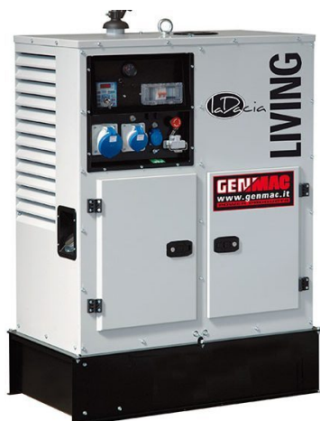
Изображение только для иллюстрации