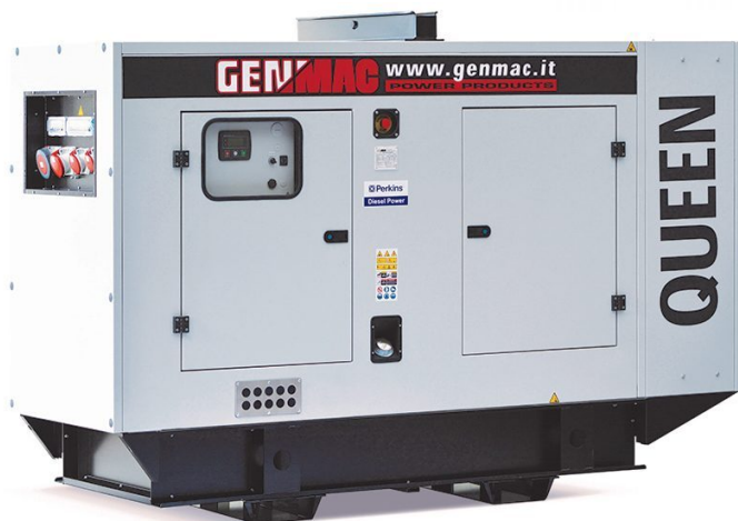
Изображение только для иллюстрации