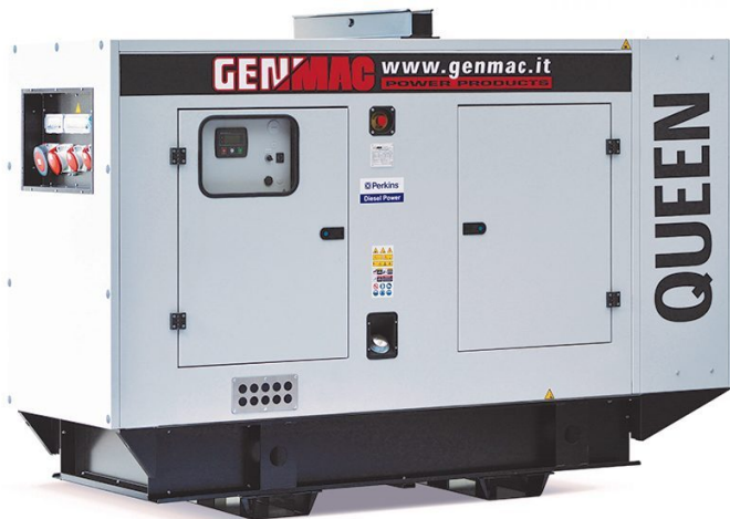
Imagen sólo para fines ilustrativos